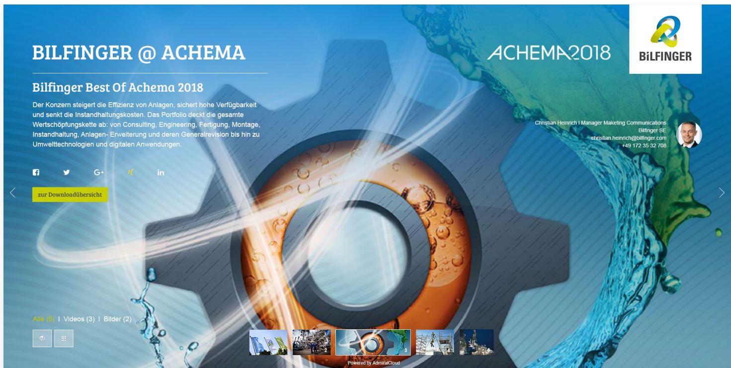
Bild: Digitale Kampagne für den Kunden Bilfinger für die Messe Achema 2018

Die PressArea bietet unterschiedliche und individualisierbare Micro-Site-Templates, die einzeln oder untereinander verlinkt eingesetzt werden können. Videos, Bilder, Audio-Files, Dokumente und Präsentationen können ausgespielt, geteilt oder zum Download zur Verfügung gestellt werden.